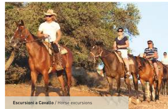
Escursioni a Cavallo / Horse excursions