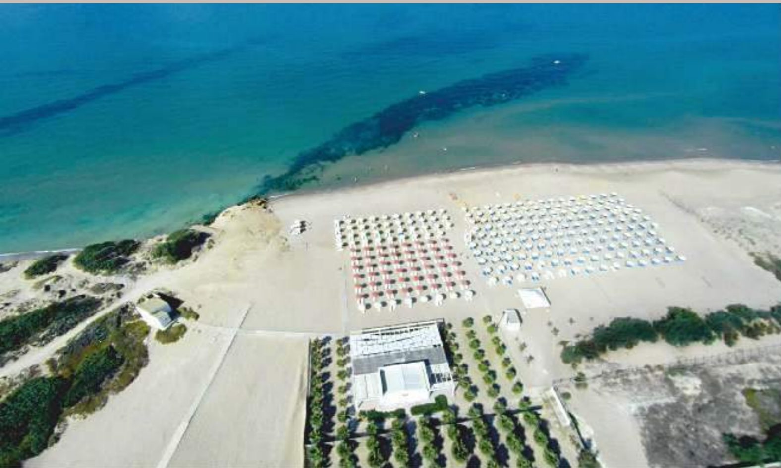
Spiaggia privata Athena Resort / Athena Resort Private beach