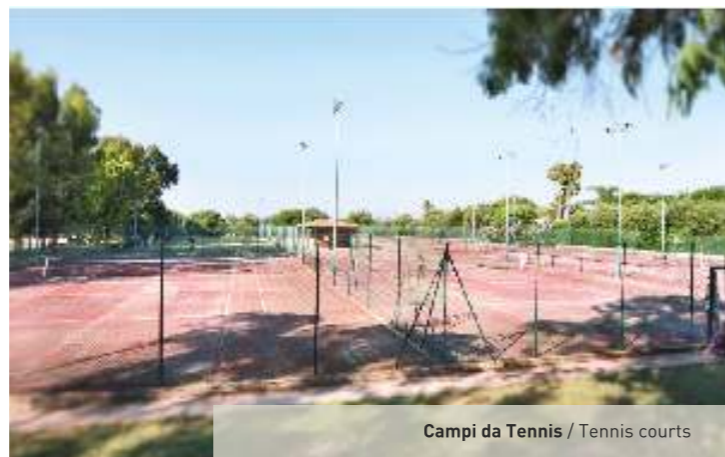
Campi da Tennis / Tennis courts