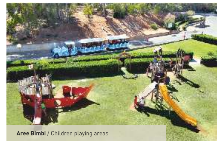
Aree Bimbi / Children playing areas

Athena Resort is also equipped with 8 tennis courts with night lighting, 4 bowls courts, archery, basketball court, volleyball court, mini golf, canoeing, paddle boat, car rental, unattended car park inside the building complex, 2 children playgrounds, Kids Club with swimming pool and large playing areas, Baby Club and Junior Club with entertainment activities at lunch and dinner time for kids. Within the service flats area there is a little chapel for the celebration of Sunday Mass, throughout the whole summer period.