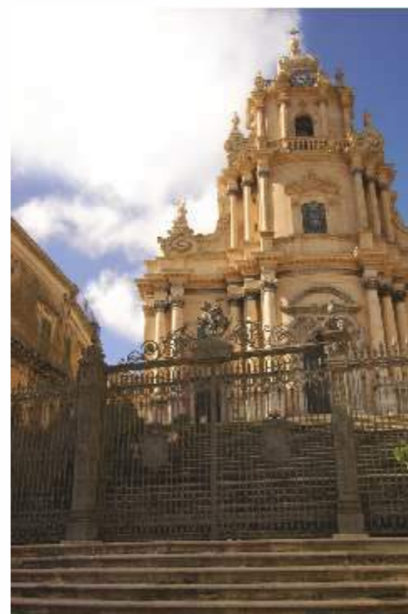
Duomo San Giorgio - Ragusa Ibla / San Giorgio's Cathedral- Ragusa Ibla