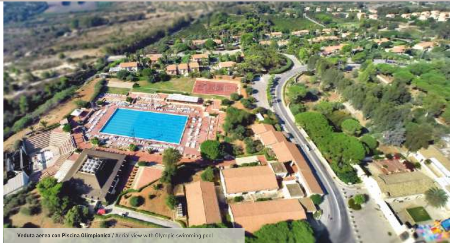
Veduta aerea con Piscina Olimpionica / Aerial view with Olympic swimming pool