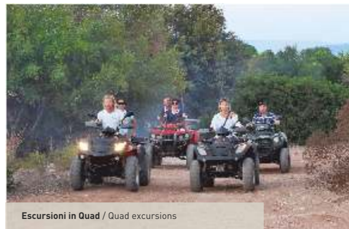
Escursioni in Quad / Quad excursions