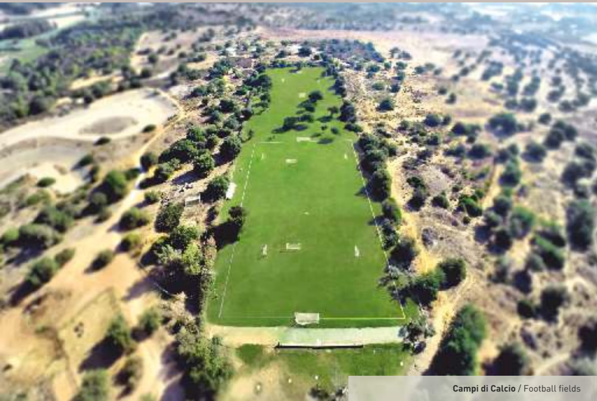
Campi di Calcio / Football fields