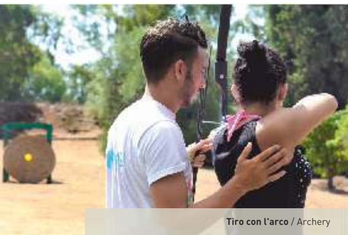
Tiro con l'arco / Archery