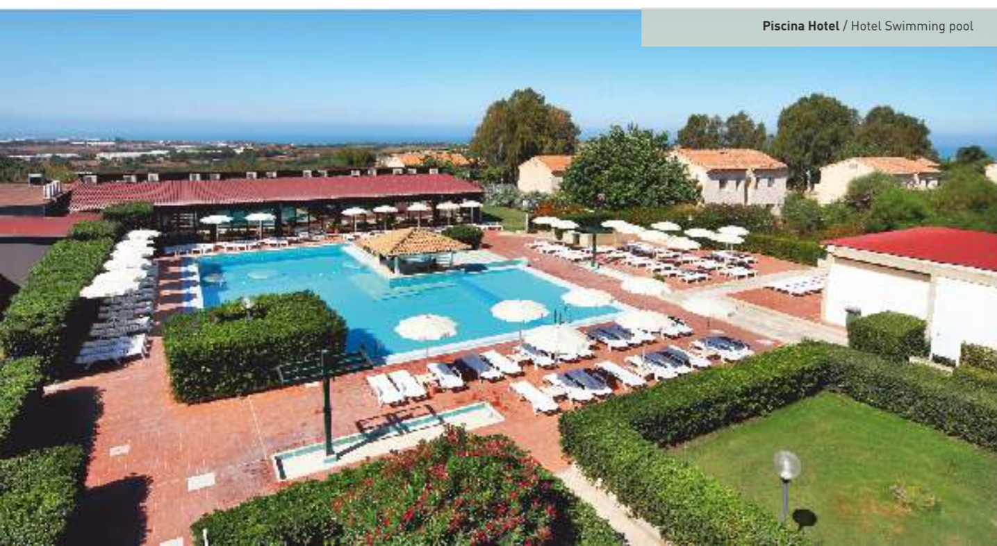
Piscina Hotel / Hotel Swimming pool

Athena Resort dispone inoltre di 8 campi da tennis illuminati in notturna, 4 campi di bocce, tiro con l'arco, campo basket, campo volley, minigolf, canoe, pedalò, noleggio auto, parking non custodito all'interno del complesso, 2 parchi giochi per i bambini, Mini Club con piscina e ampi locali dedicati, Baby Club e Junior Club, con assistenza e animazione riservata a pranzo e cena per intrattenere al meglio i piccoli ospiti. All'interno del caseggiato storico è conservata una piccola cappella per la celebrazione della messa domenicale, per tutto il periodo estivo.